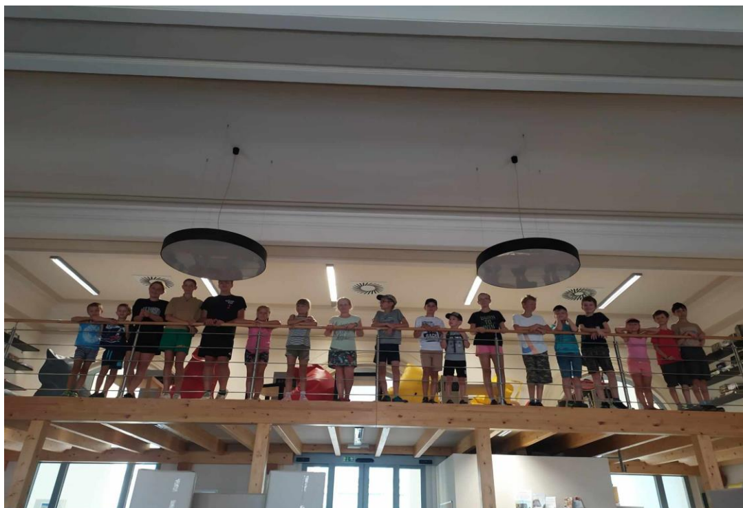
Příměstský tábor se konal nejen na hlavní budově, ale děti navštívily také pobočku na nádraží.