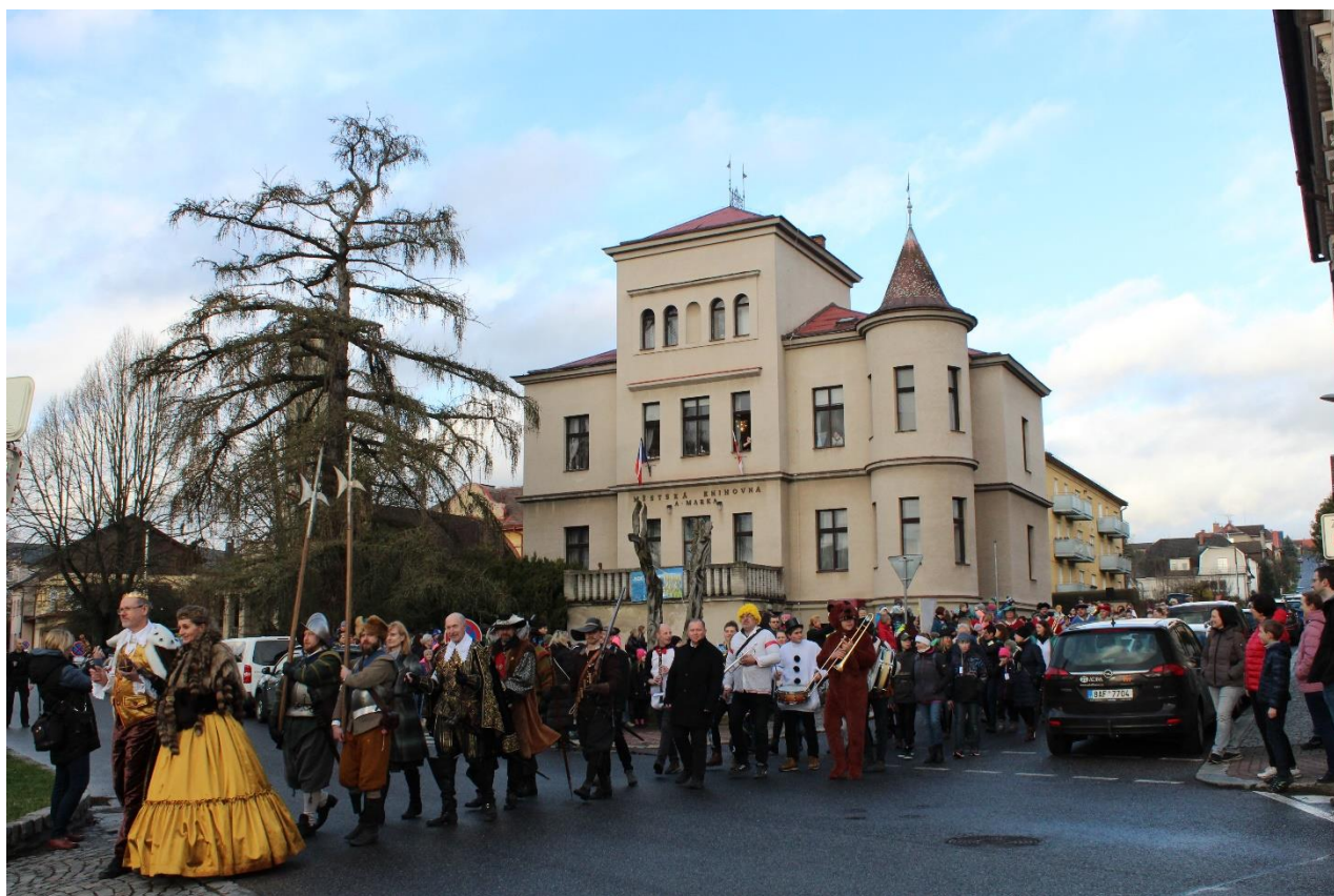
Noc s Andersenem 2023 – pohádkový průvod městem byl znovu velkolepý!

Více o historii a obecných informacích o knihovně na internetových stránkách: http://knihovna.turnov.cz/knihovna/ .