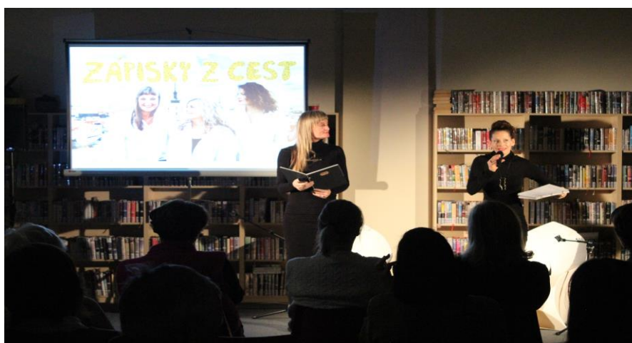
V prosinci proběhlo divadelní představení v knihovně na nádraží. Divadlo Malé(h)ry z Brna.

přednášky, semináře, poradenské služby, hry pro mládež, prostor pro trávení času – zajišťuje vedoucí ICM Turnov; více údajů o ICM Turnov poskytne vlastní výroční zpráva za rok 2023.