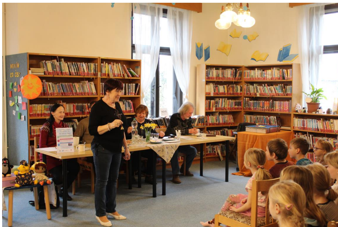
Tradiční přehlídka ve vyprávění Čteme všichni, vypráví jen někdo.