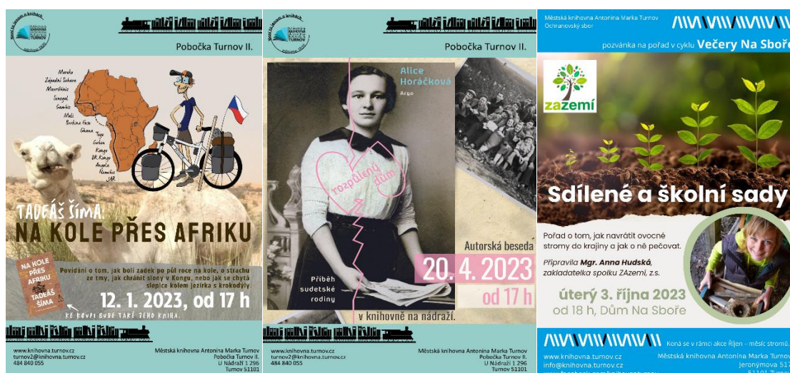
Plakáty na různorodé aktivity, jež během roku 2023 proběhly nejen v knihovních prostorech.