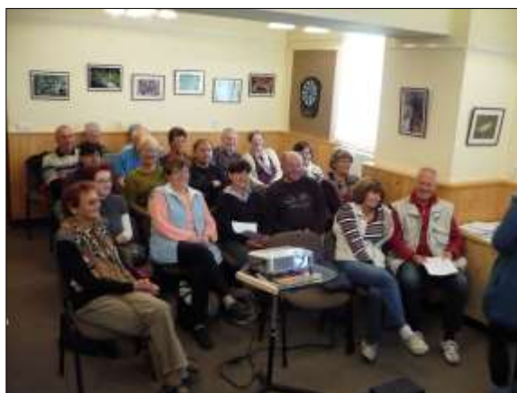
Z přednášky VU3V