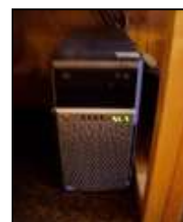
Některé novinky v IT vybavení knihovny zakoupené převážně v rámci dotace VISK3