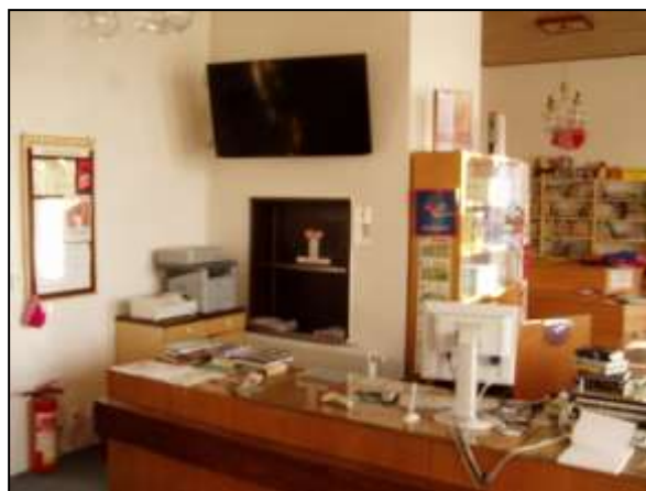
Odvíječ fólie na balení knih s řezačkou – TV k projekcím i jako infopanel na odd. pro děti a ml.