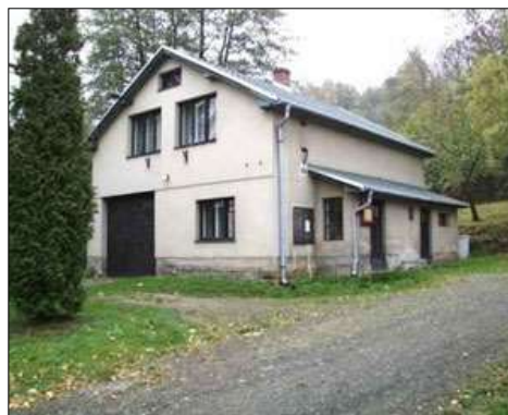
Pobočka Malý Rohozec s interiérem a pobočky Turnov II a Mašov